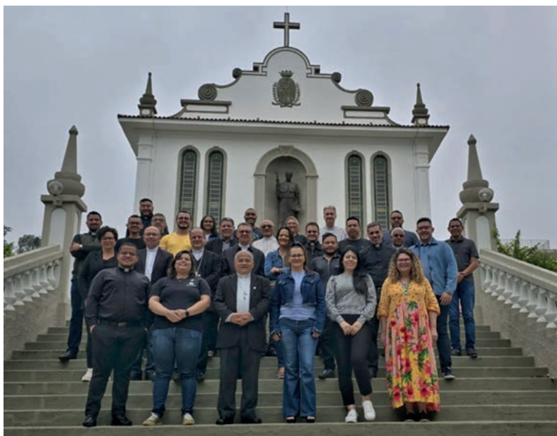
Coordenadores regionais, assessores pastorais e bispos referenciais para a Pascom no Brasil, durante reunião anual em Aparecida/SP

Na esfera da coordenação nacional, o trabalho acontece de maneira participativa e dialógica com as coordenações dos 19 regionais da CNBB. Em cada um dos 19 regionais, se reproduz a estrutura de organização da sede da CNBB, contando com presidência e bispos referenciais das diversas áreas da ação evangelizadora da Igreja. Além disso, cada uma das unidades conta com sede e colaboradores para agilizar a organização da administração e da contabilidade, contando ainda com um secretário-executivo.