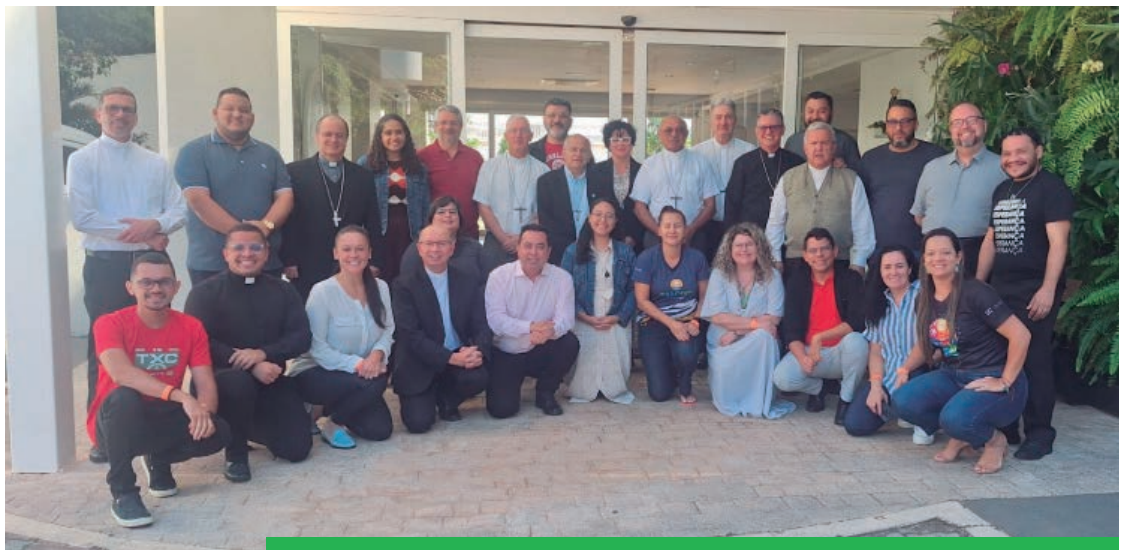
Coordenadores regionais, assessores pastorais e bispos referenciais para a Pascom no Brasil, durante assembleia anual em Brasília/DF

Especificamente no caso da Pascom, “o Regional conta com um bispo referencial, um assessor ou assessora pastoral e um coordenador ou coordenadora regional da Pascom, que articulam a comunicação em sintonia com os coordenadores diocesanos e outras atividades relativas à comunicação. A coordenação reúne-se periodicamente para avaliar e planejar o conjunto das ações da comunicação. [...] A prioridade da coordenação no Regional é animar a espiritualidade dos comunicadores, articular as ações comunicativas, produzir conteúdos e promover a formação. Nos Regionais onde existem as sub-regiões pastorais, cabe aos presidentes das sub-regiões constituir coordenadores da Pascom, podendo ser fieis ministros ordenados, consagrados e consagradas, ou fieis leigos e leigas. Estes farão parte da equipe de coordenação regional da Pascom.” (DCIB, n. 339)